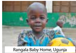
Rangala Baby Home, Ugunja