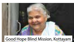
Good Hope Blind Mission, Kottayam