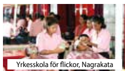
Yrkesskola för flickor, Nagrakata