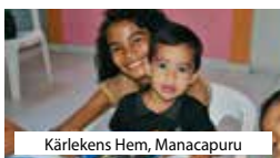
Kärlekens Hem, Manacapuru