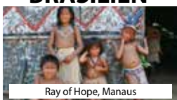
Ray of Hope, Manaus